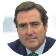
Antonio Garamendi Presidente de CEOE

De esta forma, las empresas españolas ratificamos nuestro compromiso con España, vertebrado en torno a tres señas de identidad inequívocas: independencia, sentido de Estado y lealtad institucional.