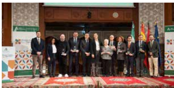
Interfresa obtuvo el premio Migraciones

empresas afiliadas han sido reconocidas. Así en el Anuario Cepyme 500 2022 en el que se premian las 500 compañías españolas líderes en crecimiento, resultaron premiadas nuestra empresa Construcciones y Reparaciones Mary y Dagrissur; a Interfresa se le ha otorgado el Premio Andalucía sobre Migraciones en la categoría de Buenas Prácticas de Inserción Laboral por su plan de Responsabilidad Ética, Laboral y Social.