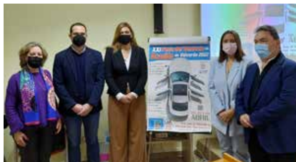
Presentación del Salón del VO

cando el 1º y 2º Concurso de Corte del Jamón y el Salón del Vehículo de Ocasión.