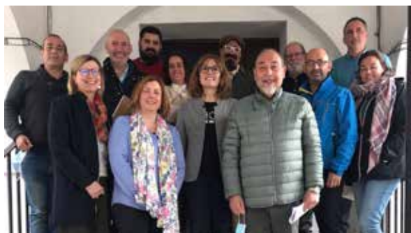
Nueva Junta Directiva AETS

para agencias de viajes especializadas en ecoturismo y destacaremos la reunión del Consejo Empresarial de Turismo con la secretaria general de Turismo, el presidente del Consejo de Turismo de la CEA y la directora general de Calidad y nuestra delegada territorial, donde se nos presentó los Planes de Sostenibilidad Turística en destino; así como el estado de tramitación de los Planes de Grandes Ciudades de Andalucía y, en concreto, el de Huelva y nos adelantó el proyecto de Ley de Presupuestos para el año 2023. Por parte de nuestras asociaciones miembro se le hizo llegar las necesidades de cada uno de los sectores que configuran nuestro Consejo y la preocupación de la FOE por el desenvolvimiento turístico de nuestra provincia que desde muchos años viene ya removiendo obstáculos para que el desarrollo turístico sea una realidad en Huelva, trasladándoles la necesidad ahora más que nunca de la colaboración público-privada en el convenimiento de que hay que sentar unas fructíferas relaciones entre la Consejería de Turismo y el sector turístico de la provincia de Huelva, englobado en nuestro Consejo.