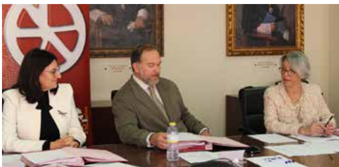
Consejo Social de la Universidad de Huelva