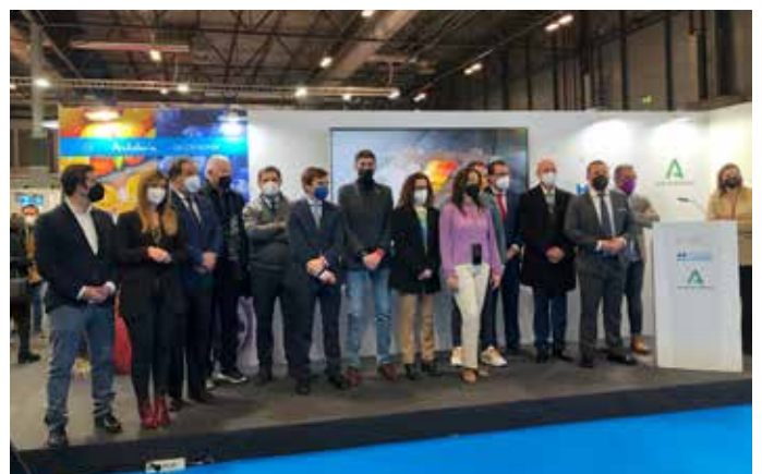
El Consejo de Turismo presente en FITUR