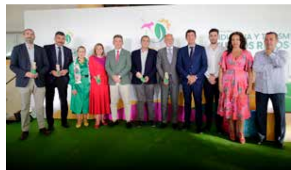
Premios Turismo Sostenible