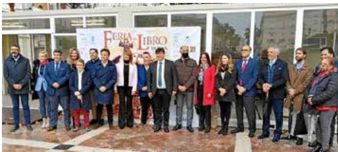
Feria del Libro

gastronomía, desfiles de moda y talleres culturales. Otras acciones de dinamización que puso en marcha el sector comercial durante el año han sido Poesía en los Escaparates -en colaboración con el Otoño Cultural Iberoamericano-, y la campaña de vales Regala, juega y sonrío. Y finalmente destacaremos la celebración de la VI Edición del Día del Comercio, donde se premiaron a más de una veintena de empresarios y trabajadores de Huelva y provincia.