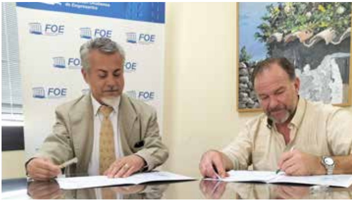
Convenio Stand4 House Asesores Inmobiliarios