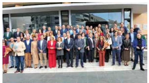
Día del Comercio

Fue durante los primeros meses cuando nuestras Asociaciones miembro empezaron a recuperar las acciones de dinamización. En el ámbito sectorial cabe destacar eventos como la Feria del Libro de Huelva. Además, las asociaciones de comercio de Isla Chica, del Mercado de San Sebastián y del centro Comercial Abierto (CCA) de las Calles del Centro, organizaron respectivamente el 'Desfile Muy Mujer', la 'Feria del Pescaíto Frito' y 'La Noche de Comercio Capital', esta última mezclando