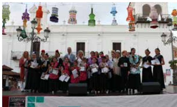
Concurso de Sevillanas de Cartaya

Nuestro Centro Comercial Abierto de FOE Valverde ha tenido una incesante actividad durante todo el año, desta-