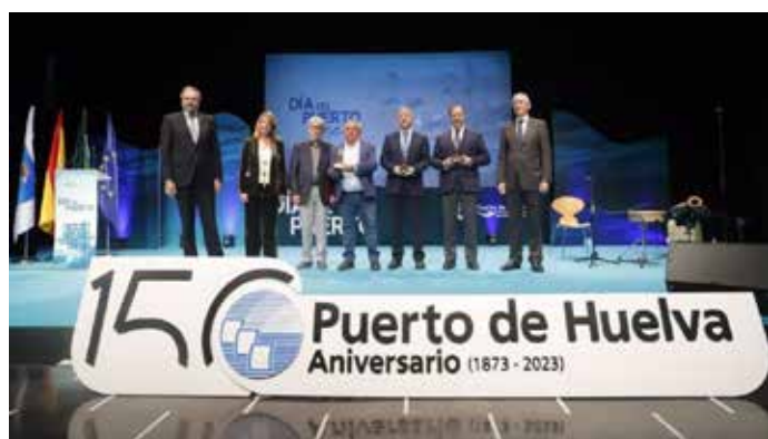
La FOE fue premiada por la Autoridad Portuaria

La economía española afronta el año 2023 en un contexto de enorme incertidumbre, los factores que seguirán afectando significativamente a la rentabilidad de las empresas continuaran siendo el encarecimiento de los precios de la energía, la alta inflación y habrá que añadir un tercer factor que es el desabastecimiento de las materias primas y sus consecuencias, existiendo otros factores también importantes, pero más secundarios, como la estabilidad política nacional e internacional, la subida de los tipos de interés o la sequía que venimos padeciendo, que afectará a la rentabilidad de nuestras empresas.