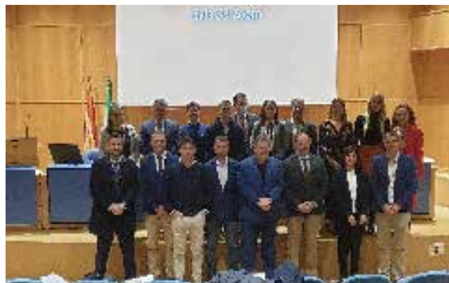
Participantes del Programa de Desarrollo Directivo

La FOE, en su compromiso con el empleo y la mejora de la empleabilidad de las personas del entorno, así como en su afán de ayudar a las empresas en la búsqueda del talento que necesitan, ha celebrado, en colaboración con la Fundación Cajazol, la I Feria del Empleo, por la que han pasado más de 500 personas.