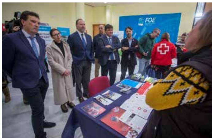
Feria el Empleo

En 2022 hemos colaborado con la Fundación para el Fomento y la Orientación Empresarial en la puesta en marcha de la IV Edición del Programa de Formación en Desarrollo Directivo.