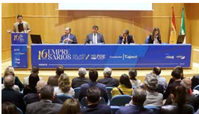
Acto entrega Premios Empresarios del Año