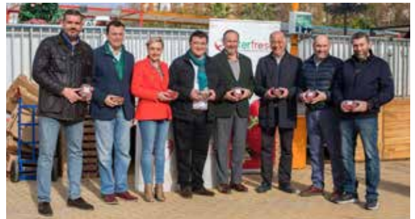
Las precampanadas volvieron a Isla Chica

Como colofón de nuestro Consejo de Apymes Locales, 21 de nuestras asociaciones pertenecientes al Consejo organizaron las tradicionales campañas de Navidad, en las que destacaremos actividades como precampanadas, concurso de escaparates, burrada y se sortearon casi cien mil euros en premio, incluyendo bonos regalo para comprar en los comercios participantes.